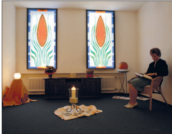
Raum der Stille

Förderverein für die Palliativstation Konto-Nr. 146 846 66 Sparkasse Freising BLZ 700 510 03