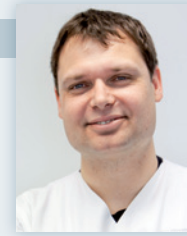
Dr. Sören Sörensen